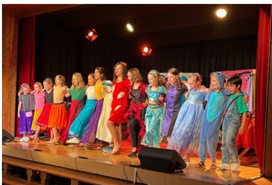
D'UN MONDE À L'AUTRE sur la scène de Froideville en juin 2025

Imaginée par Ariane Miéville, cette immersion dans l'univers de Disney est devenue, au gré du travail avec les enfants, un authentique conte musical avec des personnages costumés et un décor oriental subtilement mis en lumière. Du grand art, très apprécié par le public aussi attentif que participatif. L'ovation qui a ponctué chacun des deux spectacles restera longtemps gravée dans le cœur des P'tits Catchoux. Au final, des yeux qui brillent et le plein de confiance : la plus belle des récompenses.